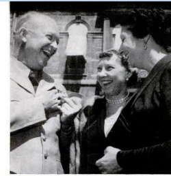
MAMIE AND FRANCE'S FIRST LADY SMILE ON IKE'S MEDAILLE MILITAIRE