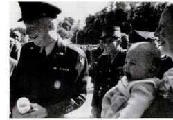
UNORTHODOX POLITICS is displayed by Eisenhower who, carrying Louveciennes citizenship award, seizes opportunity to snuggle a squalling baby.